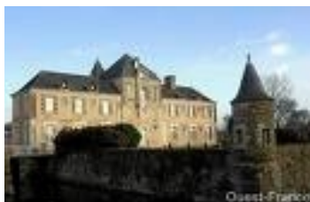
Le Château de Chassay