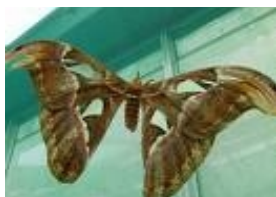
Un des 300 exemplaires

Ensuite, nous pénétrons à l'intérieur de la célèbre volière auprès de 300 papillons tropicaux qui y volent en totale liberté. Le climat de leur région d'origine est respectée : à l'intérieur des serres, la température est comprise entre 26 et 30 degrés et l'humidité est de l'ordre de 70 à 80 %.