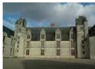
Le Château de Goulaine

Après, nous passons dans la cour d'honneur du château (XII e , XV e , XVII e siècles) ; ce château, habité par la même famille depuis mille ans, est parmi les plus beaux du Val de Loire.